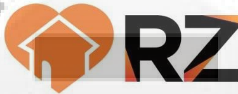
Gambar 3.1 Logo Rumah Zakat (RZ)

terbuka dan memberi kebaikan dari dan untuk masyarakat. Bentuk rumah yang tampak seperti tanda panah mengarah ke atas melambangkan pergerakan organisasi Rumah Zakat yang progresif dan terus membangun kemandirian masyarakat. Sementara hati menandakan cinta kasih yang menjadi landasan bagi Rumah Zakat dalam menjalankan aktivitas kemanusiaan dan pemberdayaan. 69