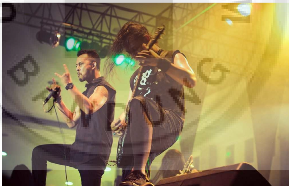
Gambar 4.1 Front Stage Dilihat dari Aspek Appearance (Penampilan)