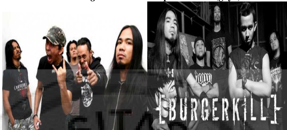
Gambar 4.3 Front Stage Dilihat dari Aspek Manner (gaya)