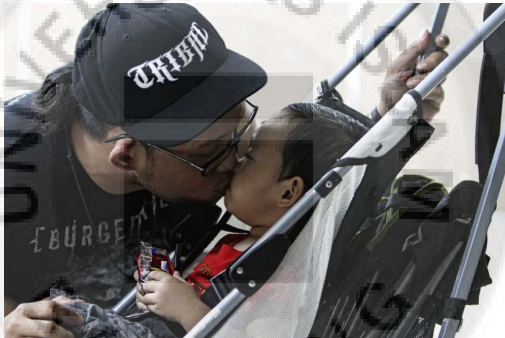
Gambar 4.4 Panggung Belakang ( Back Stage )