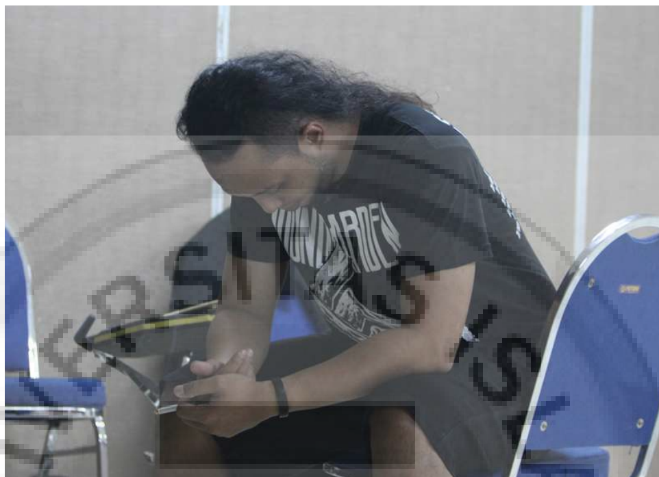
Gambar 4.5 Panggung Belakang ( Back Stage )