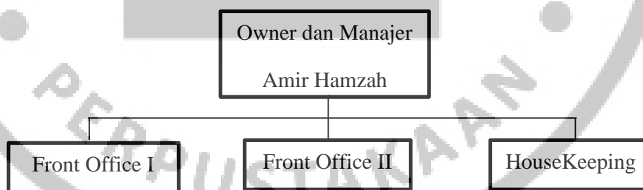
Gambar 3. 1 Struktur Organisasi Penginapan Wisma Syariah Vandera Kabupaten Garut 132

Sehingga struktur organisasi di penginapan Wisma Syariah Vandera Kabupaten Garut saat ini dikelola seluruhnya oleh pemilik penginapan yang dibantu oleh 3 orang karyawan yakni 2 orang sebagai Front Office (FO), dan 1 orang karyawan sebagai bersih-bersih. 130 Struktur organisasi dapat di tunjukkan dengan bagan diagram dibawah ini: 131