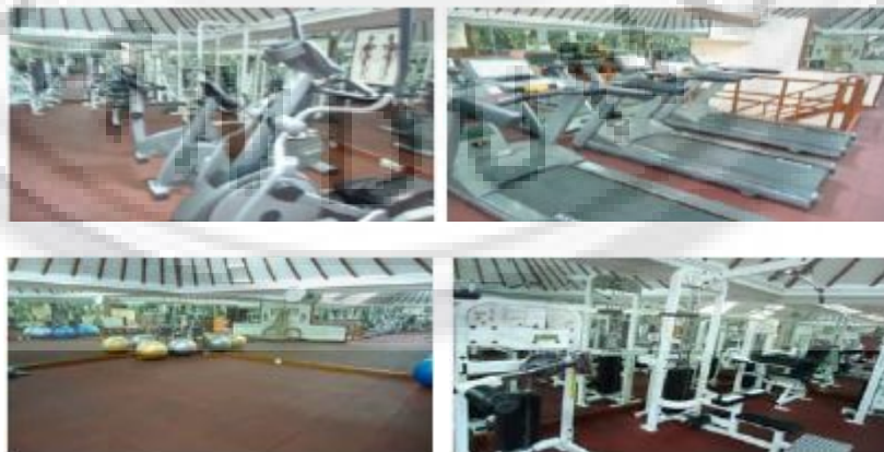
Gambar 1. Fitness Center

Keberhasilan utama bagi setiap perusahaan khususnya perusahaan jasa adalah kepuasan pelanggan, maka kualitas pelayanan adalah merupakan prioritas utama yang harus ditingkatkan dan dipelihara, karena melalui pelayanan pelanggan dapat merasakan kepuasan dan ketidakpuasan. Oleh karena itu, dalam rangka meningkatkan kepuasan pelanggan, maka kesenjangan antara harapan dan kinerja nyata yang dirasakan oleh pelanggan mengenai atribut-atribut yang dianggap penting oleh para pelanggan harus diusahakan sekecil mungkin.