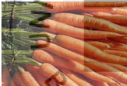
Gambar I.1 Wortel ( Daucus carota L.)