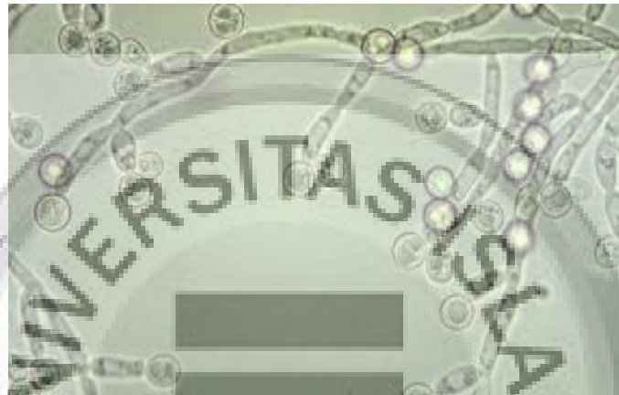
Gambar I.3. Sel Candida albicans