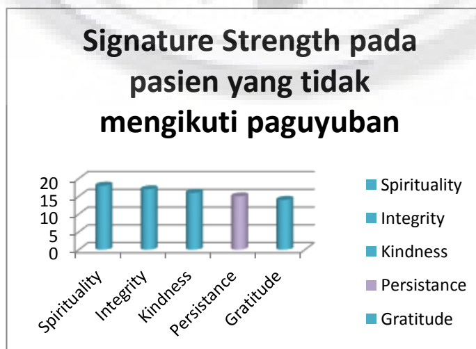
Gambaran Signature Strength pada pasien yang tidak mengikuti paguyuban