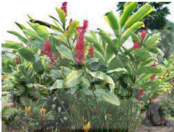
Gambar 1. Tanaman jahe merah ( Zingiber officinale Roscoe var. sunti Val.)