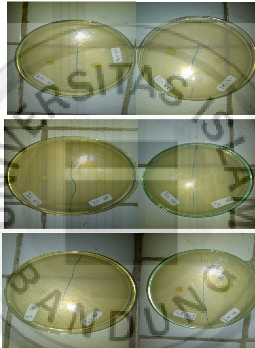
Gambar 2. Hasil pengujian ekstrak rimpang jahe merah ( Zingiber officinale Roscoe var. Sunti Val.) dan cabai jawa ( Piper retrofractum Vahl) terhadap bakteri Escherichia coli .