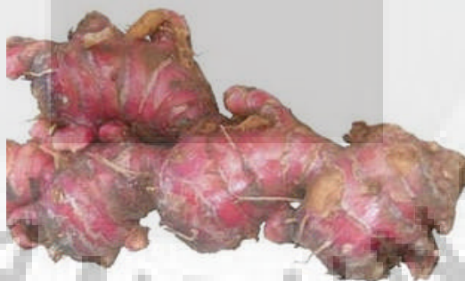
Gambar 2. Rimpang jahe merah ( Zingiber officinale Roscoe var. sunti Val.) (Wijayakusuma, 2007).