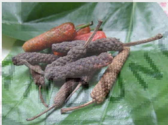
Gambar 2. Buah cabai jawa ( Piper retrofractum Vahl) (Utami, 2008).