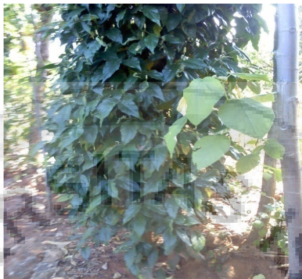
Gambar 1. Tanaman cabai jawa ( Piper retrofractum Vahl)