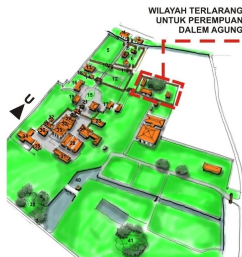
Gambar 1 Ruang Terlarang Untuk kaum Perempuan Di Dalem Agung

Di Kawasan Keraton Kasepuhan ada beberapa lokasi ruang yang dilarang untuk dimasuki kaum perempuan. Ruang tersebut adalah ruang Dalem Agung dan Ruang Makam Sunan Gunung Jati. ( lihat gambar 1 sampai gambar 3 ). Tindakan pelarangan untuk kaum perempuan berlaku hingga saat ini. Sepanjang sejarah belum pernah pelarangan ini dilanggar oleh pengunjung.