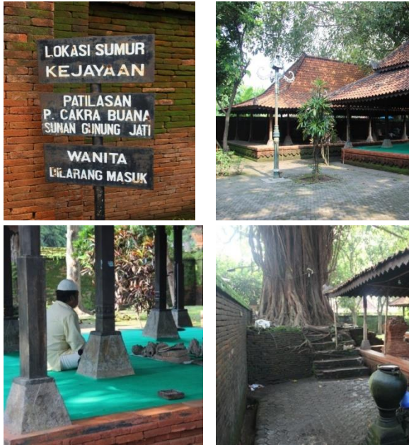
Gambar 2 Foto Ruang Terlarang Untuk kaum Perempuan Di Dalem Agung

tidak dibangun karena adanya dikotomi seperti dalam pemikiran kaum feminis. Keraton Kasepuhan dibangun berdasarkan landasan Agama Islam, dengan demikian pemikiran dikotomi itu tentunya tidak menjadi dasar karena pemikiran ini tumbuh sebelum adanya pembangunan Keraton Kasepuhan yang dibangun pada abad ke 13.