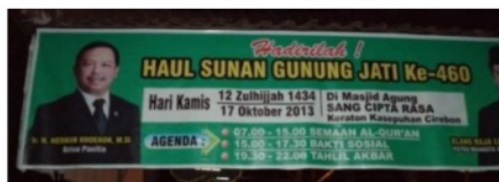
Gambar 2 Foto Anggota DPR RI periode 2009 -2014 sebagai Ketua Panitia Haul 460 Sunan Gunung Jati Di Keraton Kasepuhan Cirebon