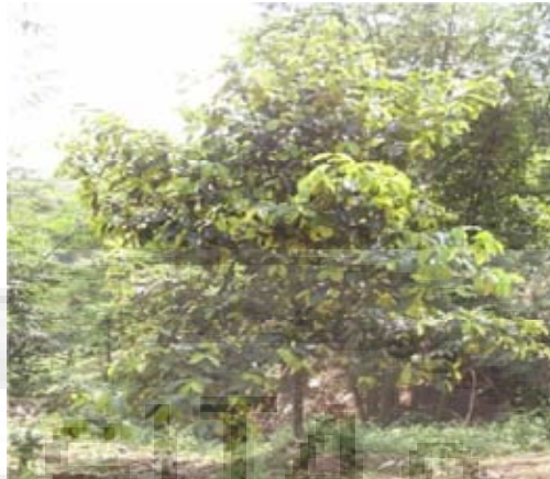
Gambar I.1 Pohon manggis ( Garcinia mangostana L )