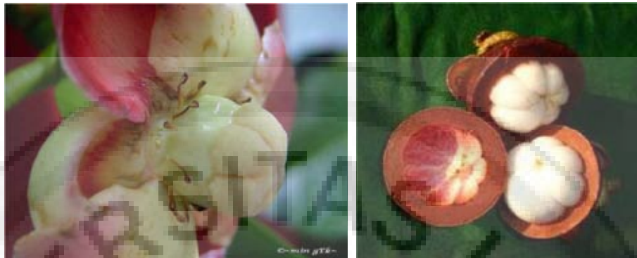
Gambar I.2 Struktur bunga dan buah manggis ( Garcinia mangostana L )

(Lim, 1984: 93-103). Biji manggis bersifat vegetatif dan mempunyai sifat yang serupa dengan induknya.