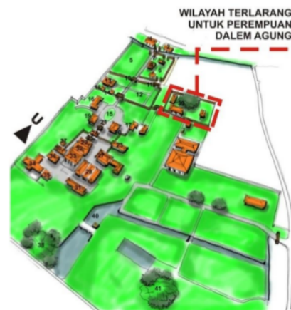
Gambar 1 Ruang Terlarang Untuk kaum Perempuan Di Dalem Agung

Di Kawasan Keraton Kasepuhan ada beberapa lokasi ruang yang dilarang untuk dimasuki kaum perempuan. Ruang tersebut adalah ruang Dalem Agung dan Ruang Makam Sunan Gunung Jati. ( lihat gambar 1 sampai gambar 3 ). Tindakan pelarangan untuk kaum perempuan berlaku hingga saat ini. Sepanjang sejarah belum pernah pelarangan ini dilanggar oleh pengunjung.