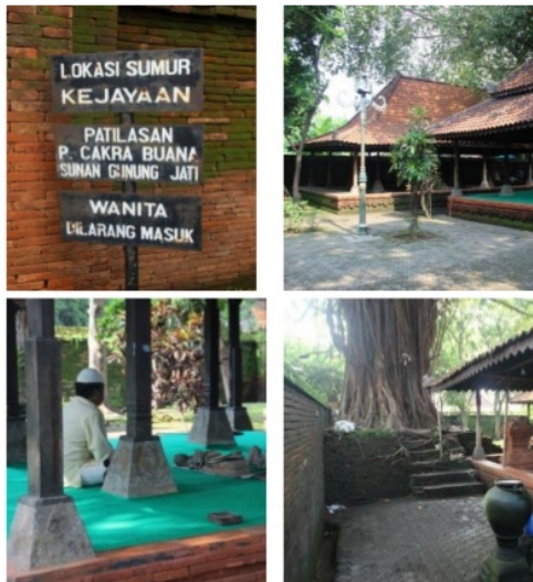
Gambar 2 Foto Ruang Terlarang Untuk kaum Perempuan Di Dalem Agung

tidak dibangun karena adanya dikotomi seperti dalam pemikiran kaum feminis. Keraton Kasepuhan dibangun berdasarkan landasan Agama Islam, dengan demikian pemikiran dikotomi itu tentunya tidak menjadi dasar karena pemikiran ini tumbuh sebelum adanya pembangunan Keraton Kasepuhan yang dibangun pada abad ke 13.