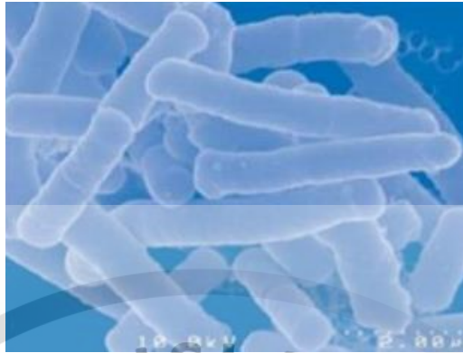
Gambar I.2. Lactobacillus acidophilus (Speck, 1978).