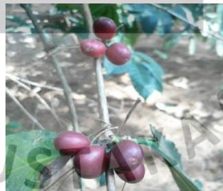
Gambar I.1. Tanaman kopi gunung palasari (dokumen pribadi)