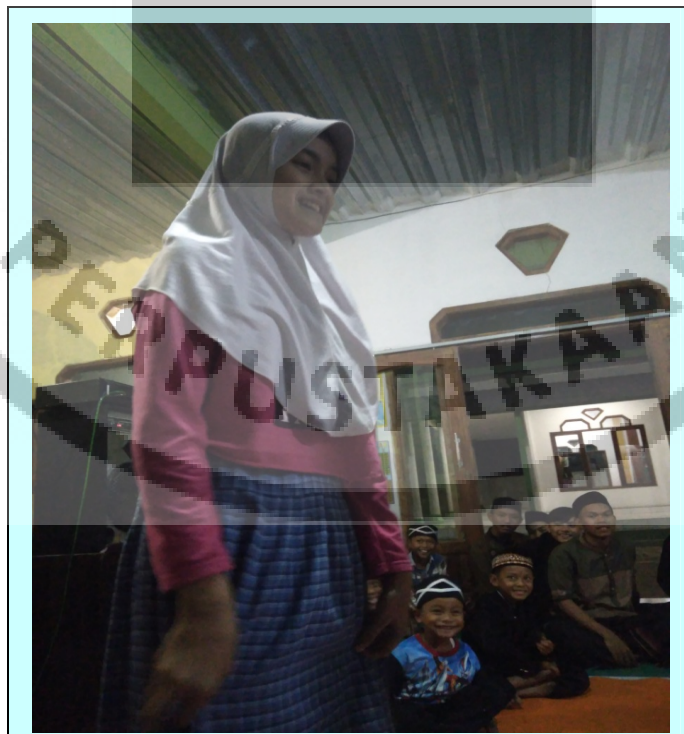
Gambar IV Penampilan Pidato