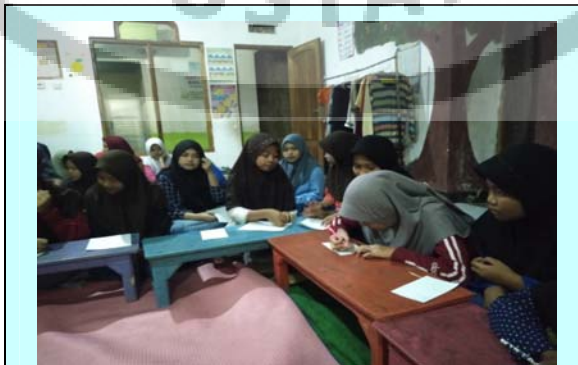
Gambar VII Pengisian Kuisisioner Dari Peneliti