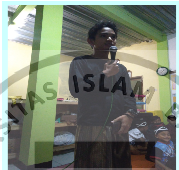
Gambar III Penampilan Pidato