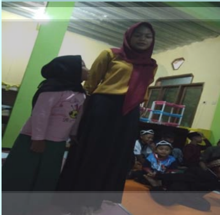
Gambar VI Pembawa Acara/ MC Muhadharah