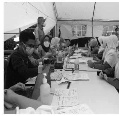
*Suasana Vaksinasi Covid-19 di Masjid Salman ITB