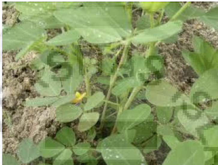
Gambar I.1 Kacang tanah

putih hingga merah muda, merah, ungu, coklat kemerahan dan sedikit kecoklatan. Setiap biji memiliki dua keping biji yang lebar, epokotil dengan daun dan tunas primordial, hipokotil dan akar primer (Shorter, 1992:35-36).